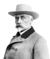
VIGGO HØRUP (1841-1902) STIFTER AF POLITIKEN I 1884

Redaktionen forbeholder sig ret til at redigere i indsendte tekster og til også at bringe teksterne på politiken.dk/debat. Vi bringer kun tekster alene sendt til Politiken. Opstår der problemer, kan du ringe til os på 33 47 12 00 eller 70 15 01 01.