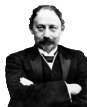
EDVARD BRANDES (1847-1931) STIFTER AF POLITIKEN I 1884